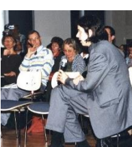
Publikum: Einbezogen in den Diskurs mit den Referenten ...