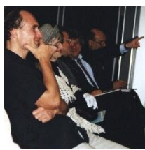
Publikum: Warum nicht auch einmal in heilerer Gelassenheit ...