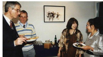
Soiree im Institut (IEPG): Im Kreise von Freunden und Mitarbeitern