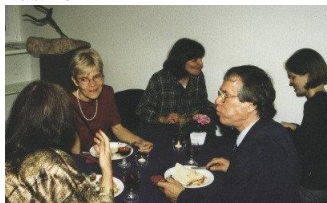
Wissenschaft und Kunst im Gespräch - unter Freunden auch ein persönliches Wort!