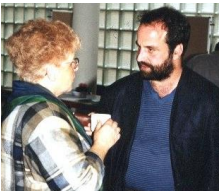
Pausengespräch im Foyer: Theologen - auch einmal - unter sich.