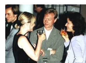
Pausenambiente im Foyer ...